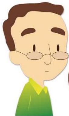
聴覚に障がいを持つ方